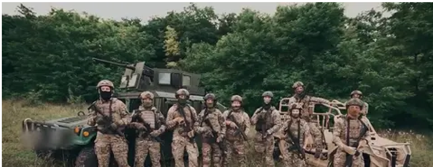
"Українська команда" передала дрони