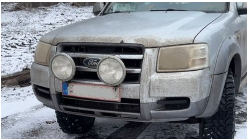
Автівка, яку волонтери передали бійцям на Сумському напрямку.

“Допомога йде від волонтерів значна. Тому, що є такі випадки, коли участь держави вона проявляється, але все це затягується, а волонтери набагато оперативніше реагують”, – каже воїн.