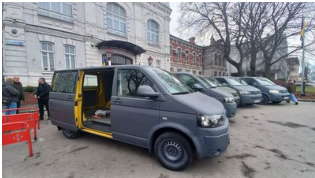
Відкрита автівка для ЗСУ, 30 січня 2025, Хмельницький.