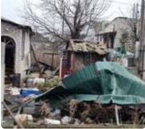
Фото: м. Куп'янськ.

На Куп'янському напрямку за добу відбулося 11 атак окупантів. Сили оборони відбивали штурмові дії противника неподалік Степової Новоселівки, Колісниківки, Глушківки та Загризового.