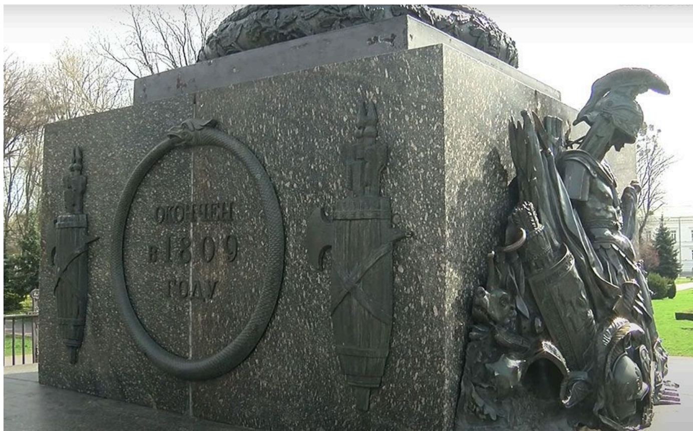
Підніжжя колони у концепції Третього Риму