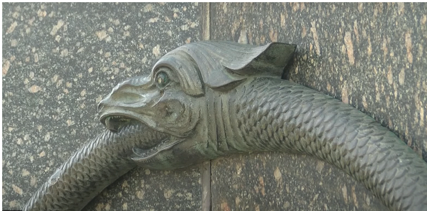
Уроборос — змія, який кусає себе за хвіст, тобто символізує вічність

На пам'ятнику можна вгледіти різні композиції. «Кільце повернення» — алегорія вічності у сенсі вічного світового панування росіян як «третього Риму». Гармати символізують постріли у Мазепинську ідею, в українську незалежність як щось ТИМЧАСОВЕ. Ідея титаномахії означає ВІЧНЕ правління росіян, як у випадку із Зевсом.