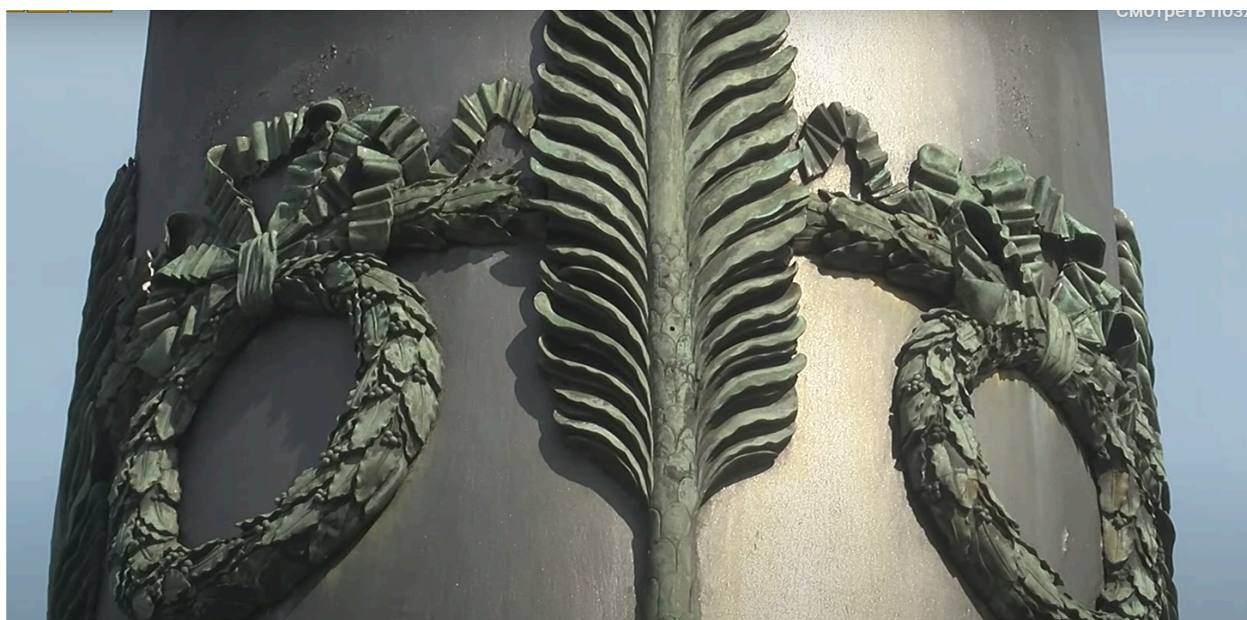
Горельєфи на колоні у концепції Третього Риму

Ця ворожа філософська течія стверджує, що Москва (читай — Московсько-Петербурзька держава або Російська імперія) є наступницею Римської імперії. Відомий вислів: «Москва — третій Рим, а четвертому не бути». Такі сенси лягли у основу месіанського світогляду під час формування Московської централізованої держави. Ідея «третього Риму» є одним із різновидів ідеології «руського міра» й передбачає поглинання України, вищість росіян над іншими націями та світове російське панування. Цю ідею ширив і по-новому інтерпретував, актуалізував і масштабував у інформаційному просторі росії їхній філософ Дугін. Закономірно, що ідея «Третього Риму» нині використовується російськими пропагандистами, найчастіше Соловйовим і Скабєєвою, для ідеологічного обґрунтування війни проти