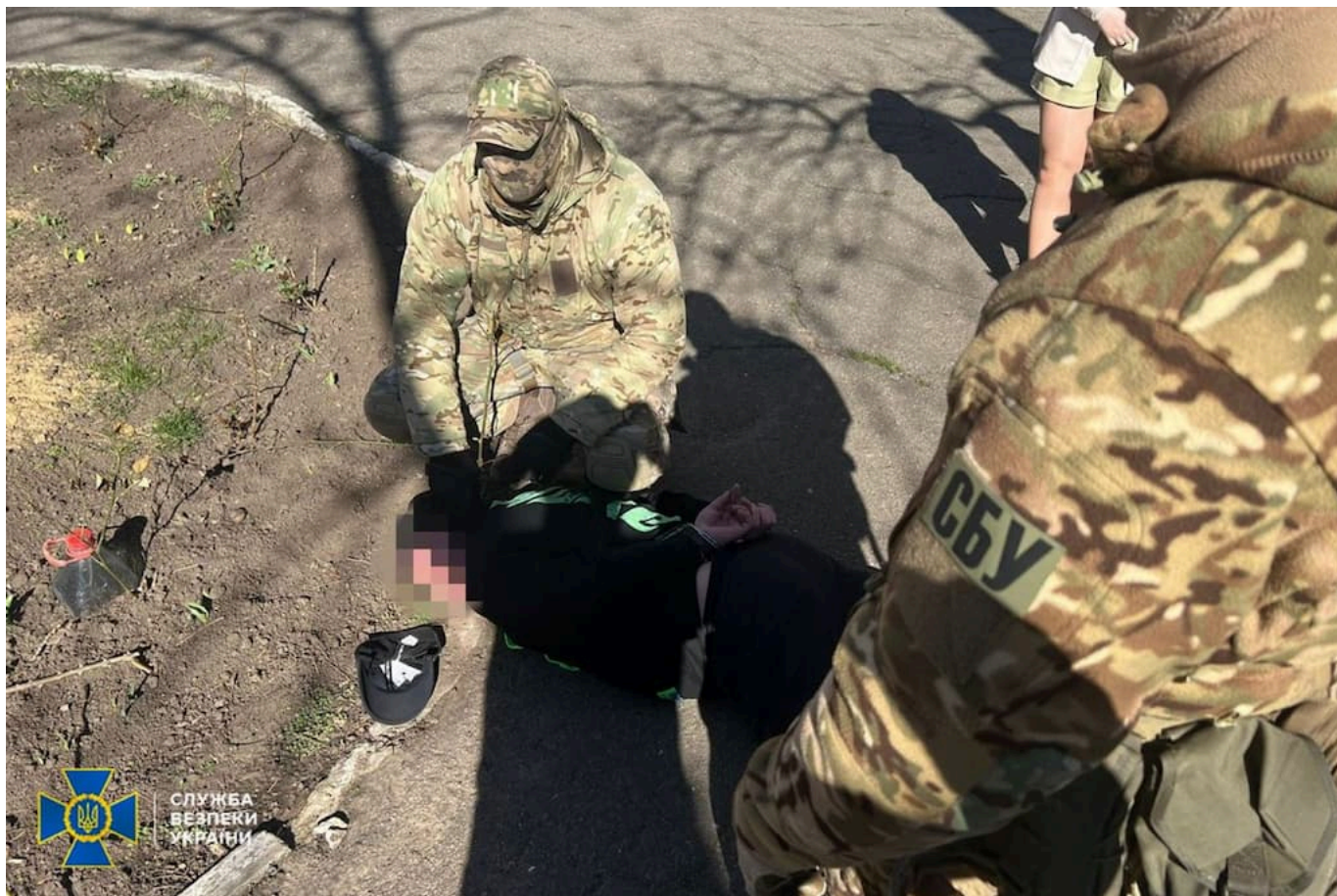
Колишній правоохоронець добровільно став зрадником, запропонувавши рашистам свої послуги в обмін на керівну посаду, якщо ті захоплять Одесу.

Слідчі СБУ повідомили йому про підозру за ч. 2 ст. 111 Кримінального кодексу України (державна зрада, вчинена в умовах воєнного стану).