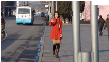
Останні фото Північної Кореї, які зняли на приховану камеру

За його даними, 20 січня, броньована техніка армії РФ рухалася в напрямку українських позицій в районі Піщаного.