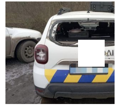
Начальник поліції Харківщини розповів, як та чому за українськими правоохоронцями