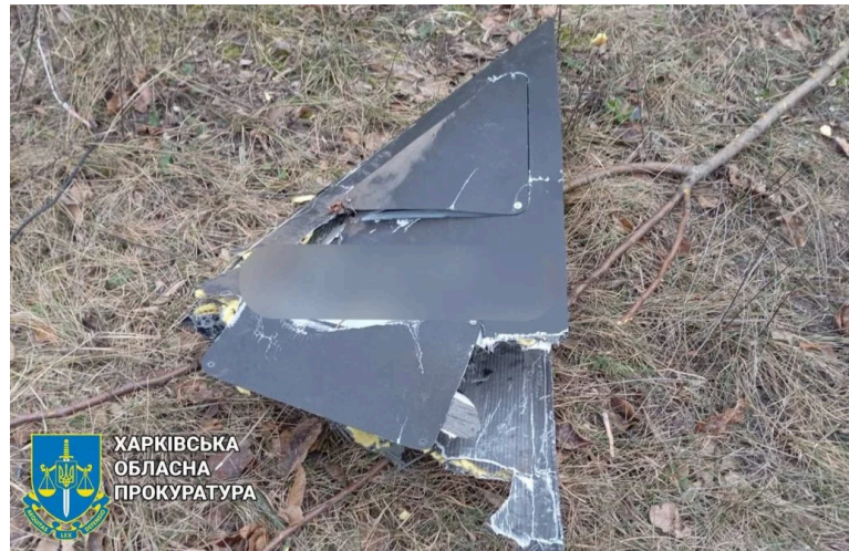
Наслідки атаки БПЛА по Куп'янську

У селі Попівка атака БПЛА пошкодила житловий будинок. У Лимані потерпіла господарська споруда: уламки збитого «шахеда» впали на відкриту територію.