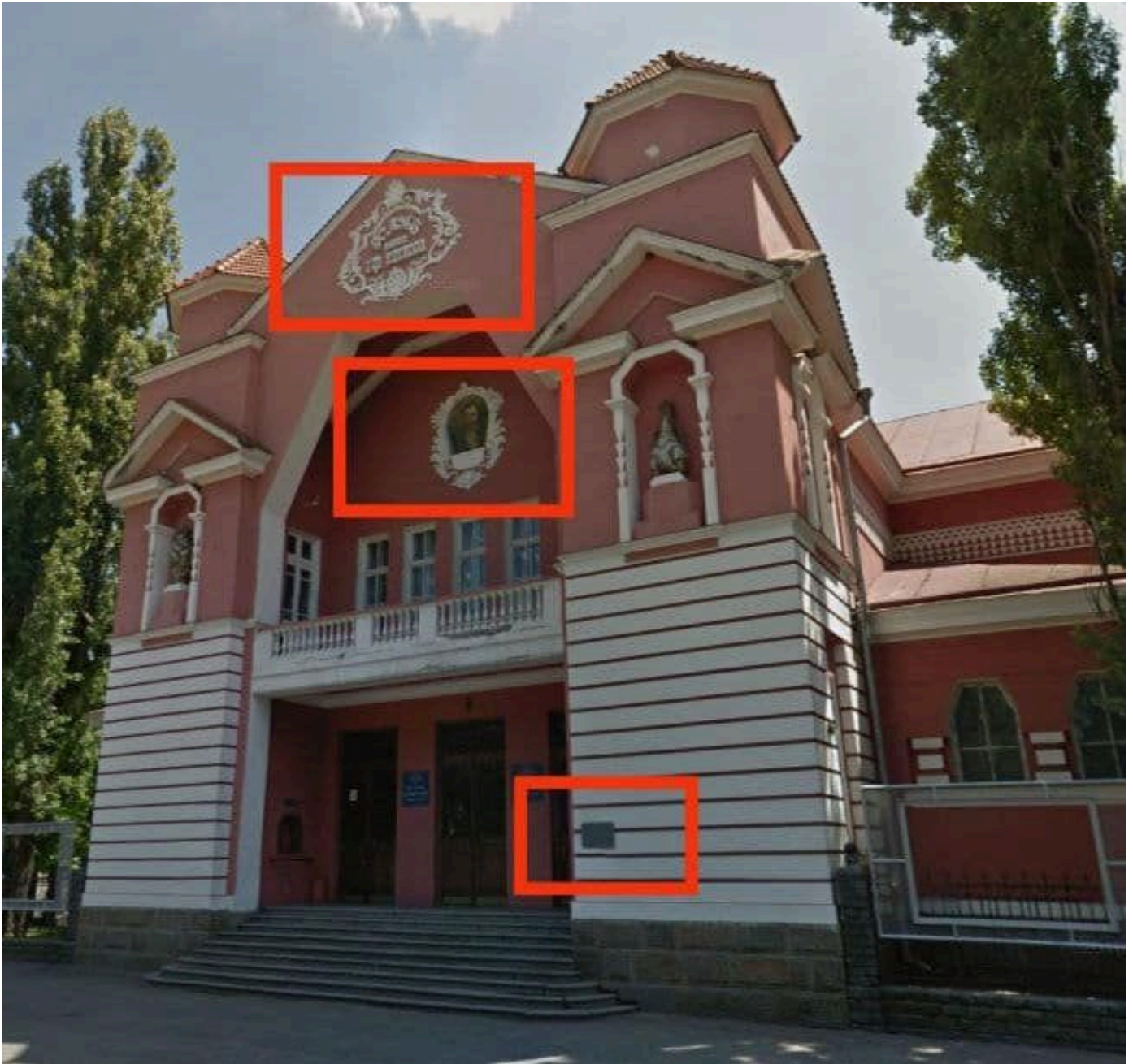
Палац культури: до