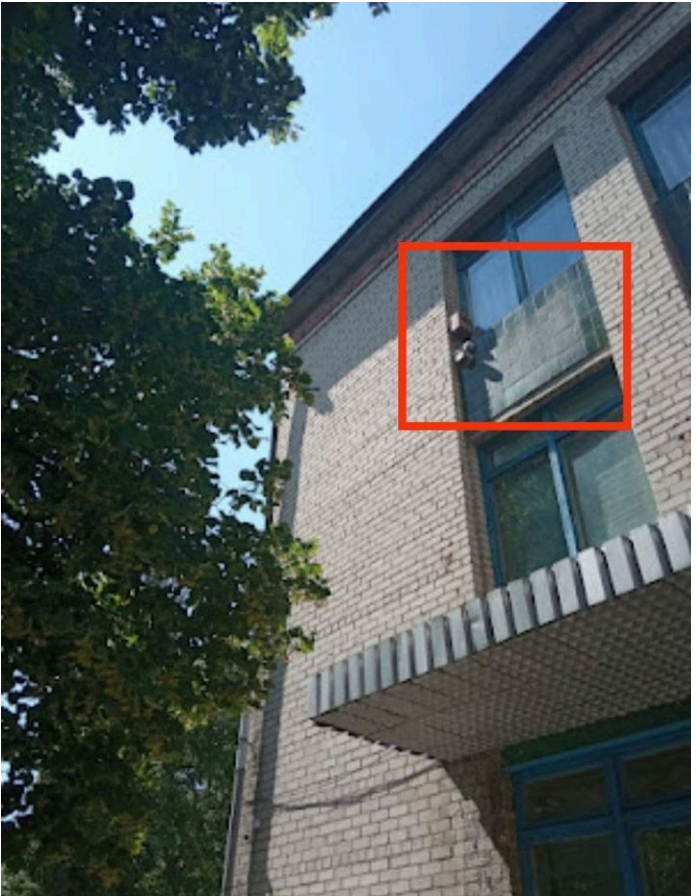
Фасад будівлі Кременчуцького регіонального центру професійно-технічної освіти №1

«А ще у Кременчуці майже покінчено з культом більшовика Івана Котлова. Він народився 7 лютого 1874 року в селі Шликова Костромської губернії Росії. Працював вантажником Путилівського заводу у Петербурзі. Також малярем вагоноремонтної майстерні Кременчука, де познайомився із майбутнім „всесоюзним старостою“ і одним із організаторів голодомору-геноциду Петровським. У 1902 р. організовує в середовищі