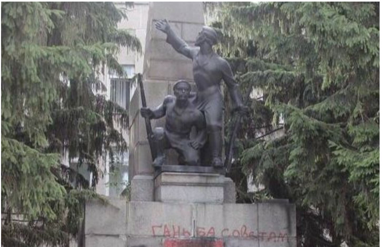
Пам'ятник «Борцям за владу рад» у Кременчуці