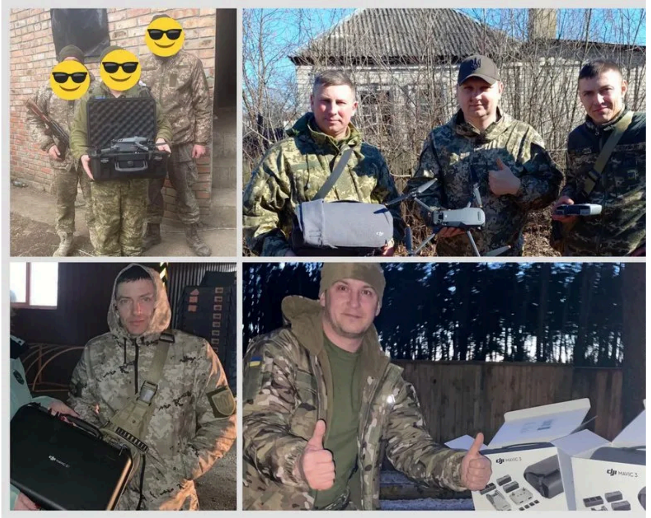
Дрони, на які ми з вами зібрали мільйон гривень