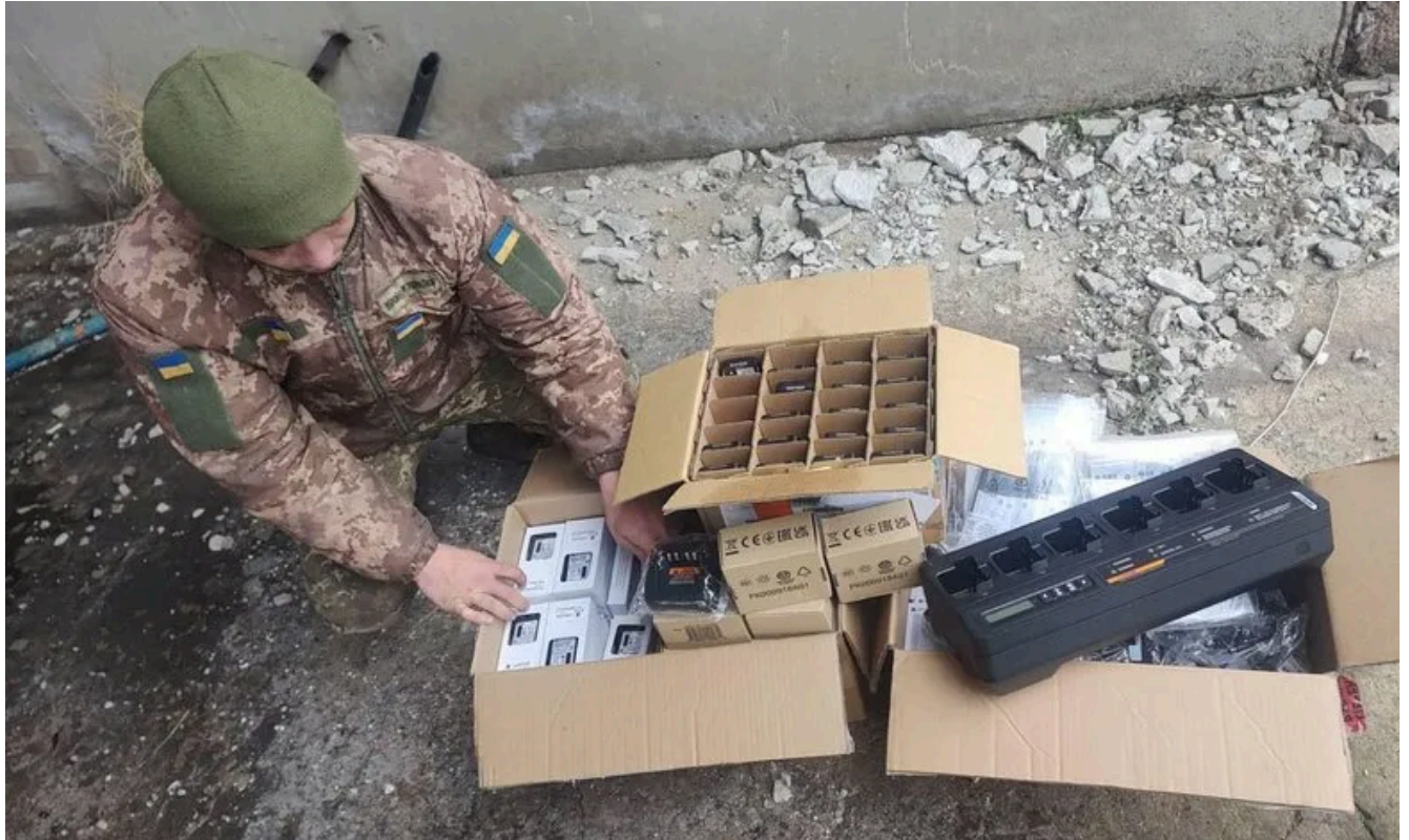
Рації, придбані для 24 ОМБр за зібрані 600 000 гривень

Перший масштабний збір нашого Фонду 24 був на суму 600 000 гривень. На кошти, які нам разом вдалося зібрати за тиждень, ми придбали 20 рацій для 24 окремої механізованої бригади. Також ми придбали 20 запасних батарей до них і зарядну станцію на 6 пристроїв.