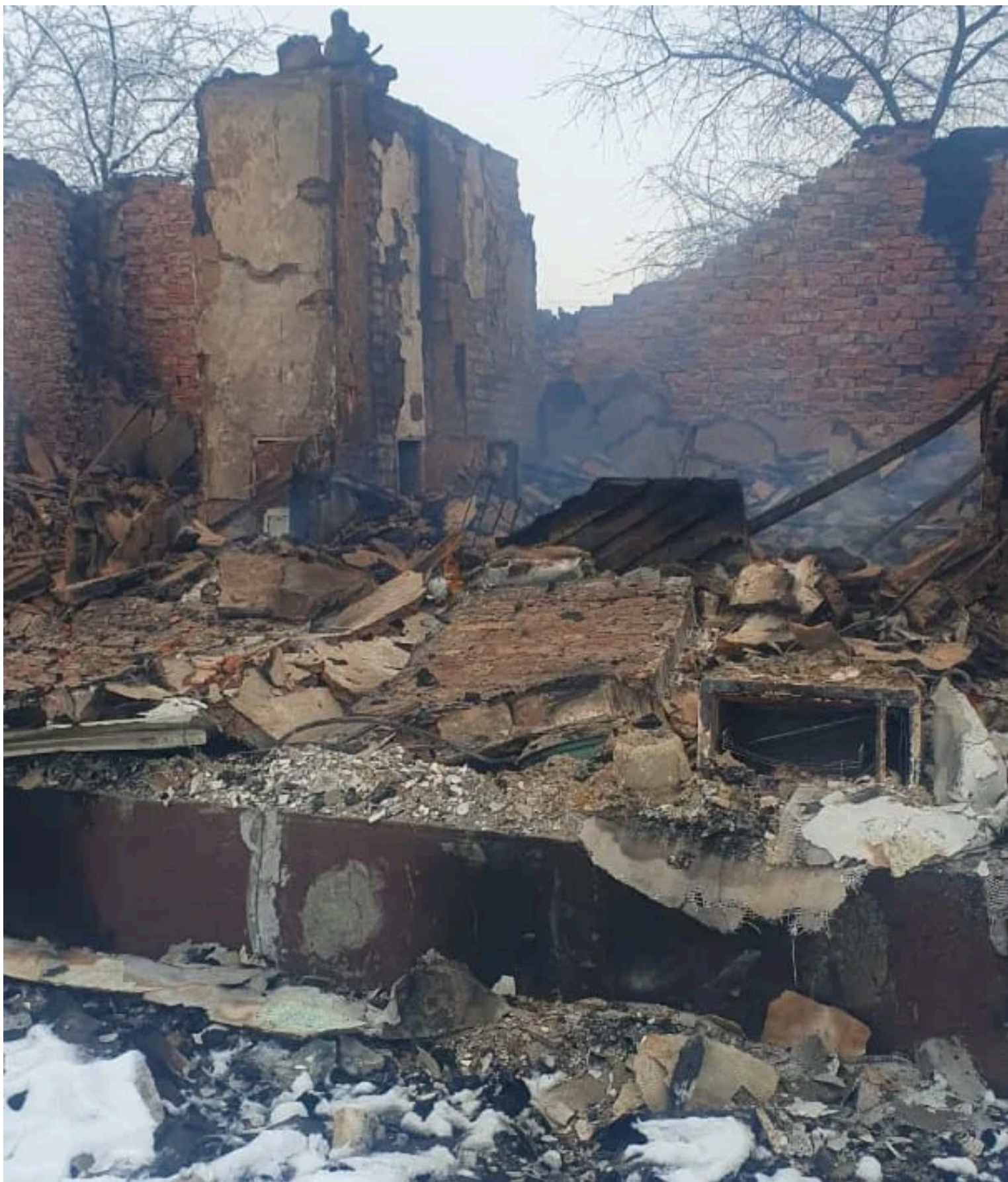
Наслідки обстрілу Золочівщини.