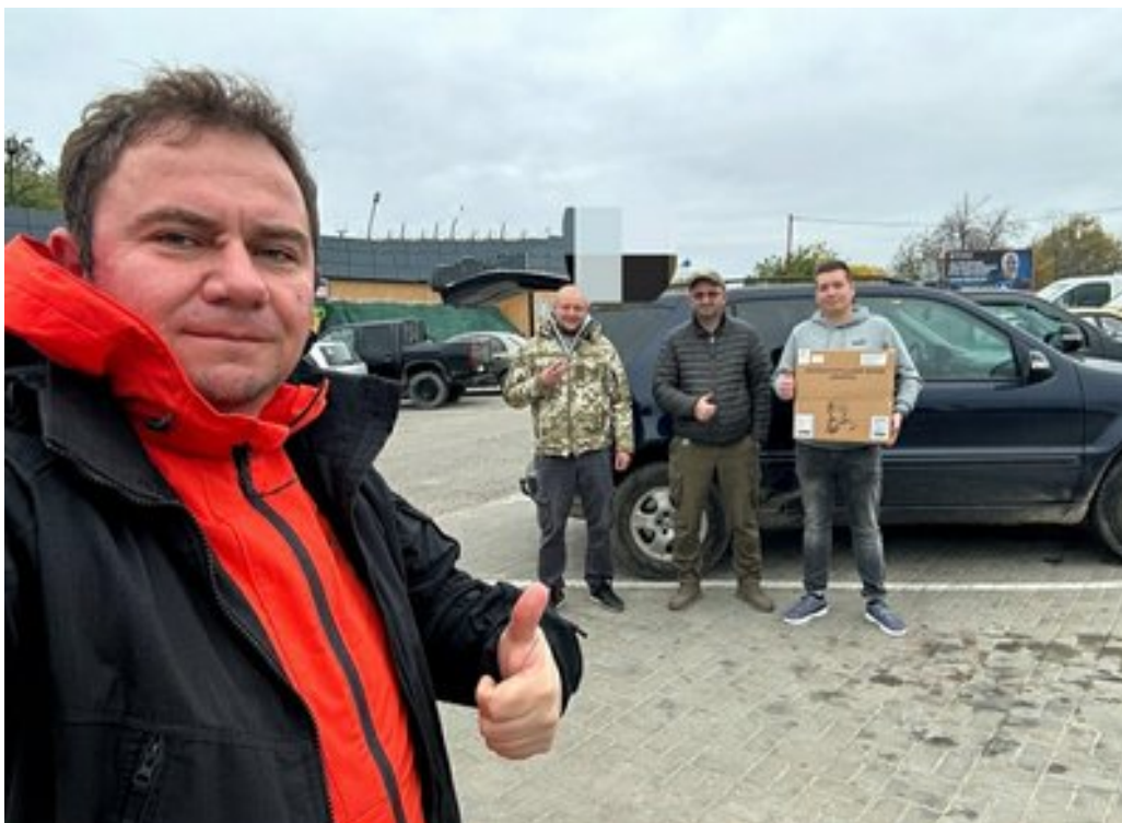
Передача авто та дронів на півдні України.

"Це було 13 чи 15 березня. Йшла інтенсивна оборона Києва. Другий раз, на свій день народження, 7 квітня, я вже потрапив до Києва. І це були абсолютно інші відчуття. Це були відчуття здобутої щойно волі, свіжої, з печі щойно", — згадує він.