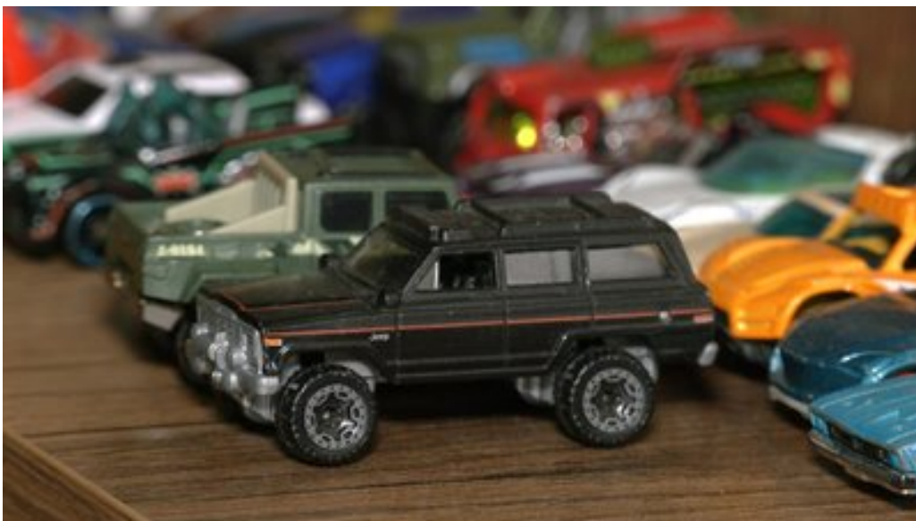
Машинки Устима Зайльо.

Також військовий пообіцяв Устиму, що у майбутньому вони разом куплять нову машинку до його колекції.