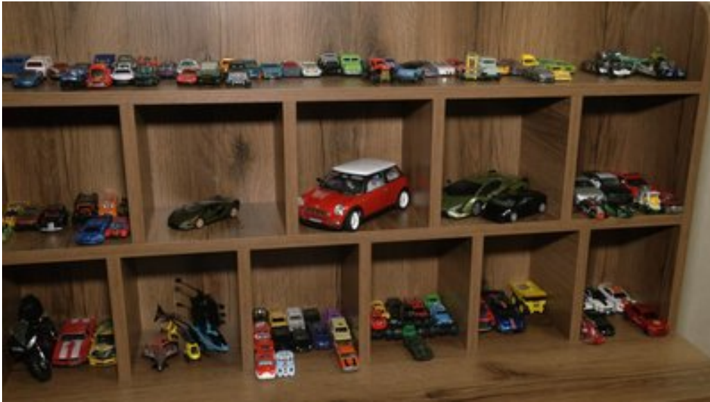
Машинки Устима Зайльо.

"Він віддавав навіть ті машинки, які не були у продажу, і не були пофотографовані. І віддавав навіть найдорожчі для нього", — каже мама Устима.