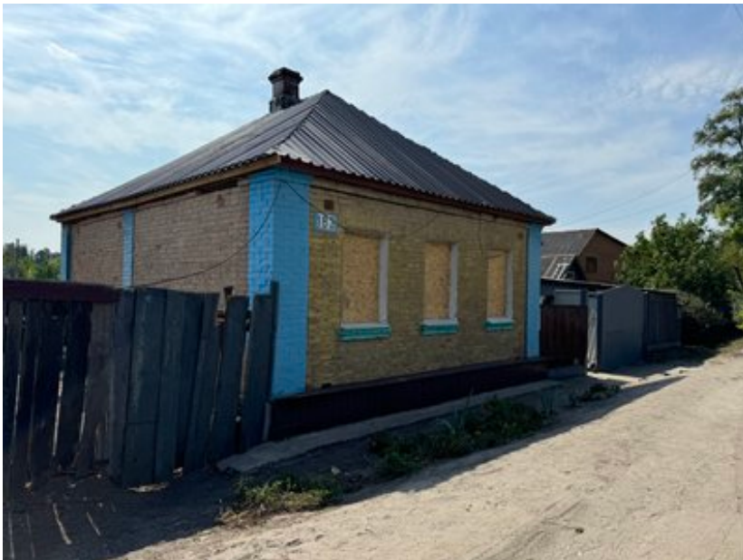
Наслідки обстрілу Білопілья серпень 2024 рік.

Зараз ще новий виклик, коли вимагається, щоб мінімальна заробітна плата була не менше 13 800 гривень, наприклад, у працівників водоканалу, які припадають на мобілізацію. Тобто, ще треба підвищувати заробітну плату, це означає, що ще повинен вирости тариф, але аналогічно ми не можемо допустити підняття тарифів, тому ми знову беремо на себе відшкодування цього тарифу своїм коштом.