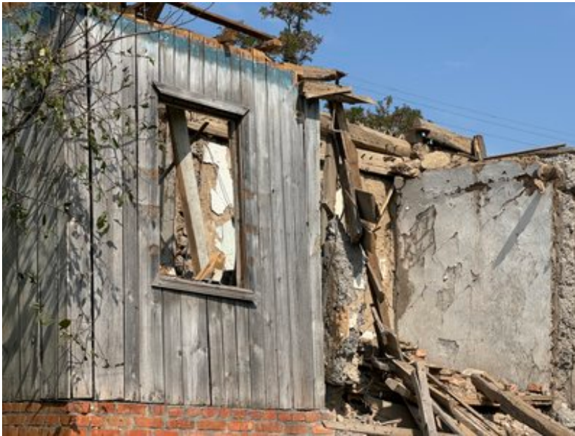
Наслідки обстрілу Білопілья серпень 2024 рік. Суспільне Суми