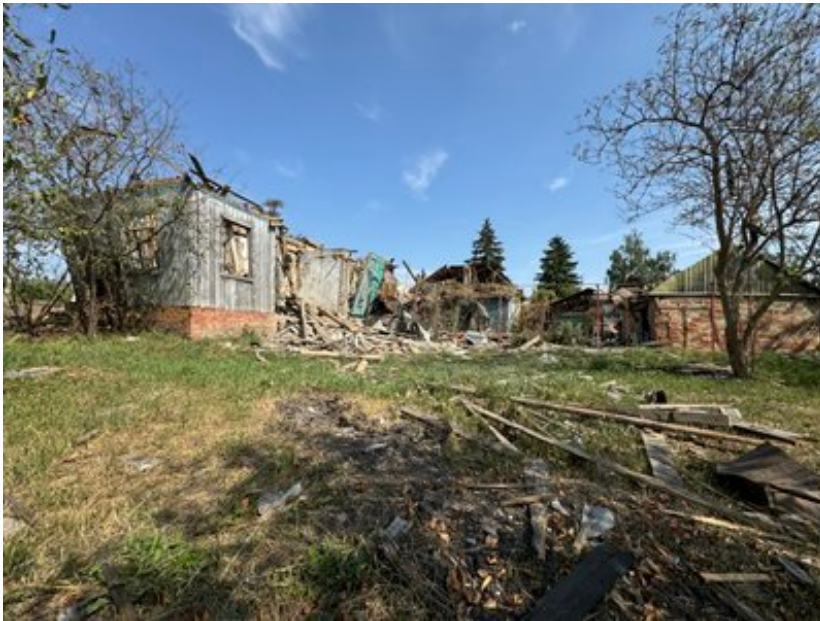
Наслідки обстрілу Білопілья серпень 2024 рік.