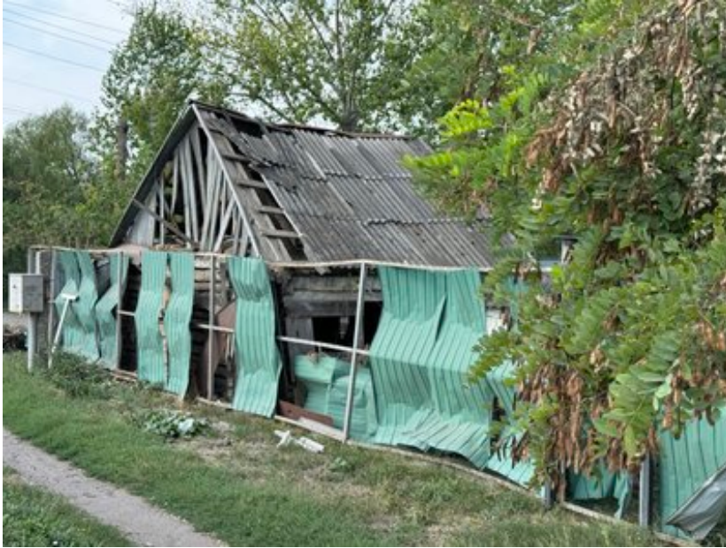
Наслідки обстрілу Білопілья серпень 2024 рік.

Менше буде зроблено доріг чи якісь ремонти доріг. Звичайно, що в цьому році не будемо робити ніякого нового будівництва. Я думаю, що у порівнянні з 2024 роком ніхто не постраждає.