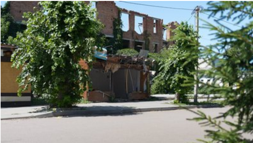
Білопільці, липень, 2024 р.

Білопільці не тільки виживали, а і забезпечували всі необхідні потреби своїм людям, хоча це було важко, тому що не тільки люди виїжджали, а ще й магазини, установи, заклади, банки, аптеки й все інше. Після кожного великого обстрілу у квітні і травні дуже багато людей виїздило. Потім був час, коли можна було пів за пів години побачити лише одну-дві людини в місті. І навіть машини проїжджі боялися проїздити містом. Могли снаряди чи бомби падати просто серед проїжджої частини.