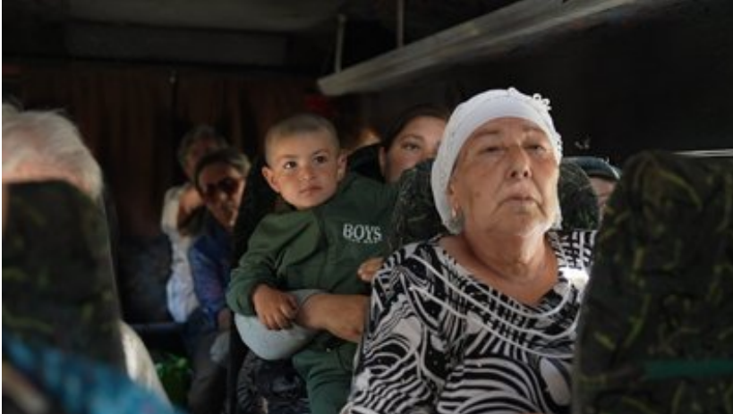
Мешканці Білопільці під час евакуації з міста, Сумська область, 21 червня, 2024 р.

Рік був дуже важкий через те, що мали людські жертви та великі руйнування. Це психологічно важко. Люди евакуювалися, також в цьому році ми мали примусову евакуацію наших дітей. Дуже незвично бути у місті, де немає дітей. Ми нікому не можемо побажати, щоб люди бачили місто без дітей.