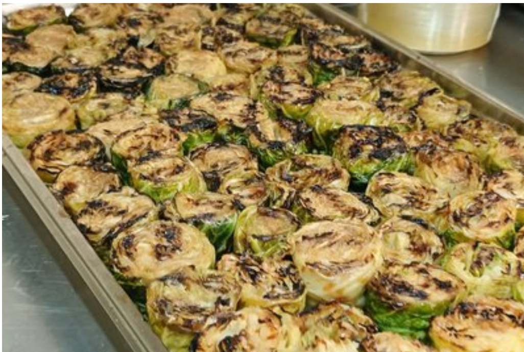
Фірмова страву Темура Парцванія.

Шеф-кухар з Грузії Темур Парцванія на гастровечір приготував свою фірмову страву — савойську капусту із сиром тофу.