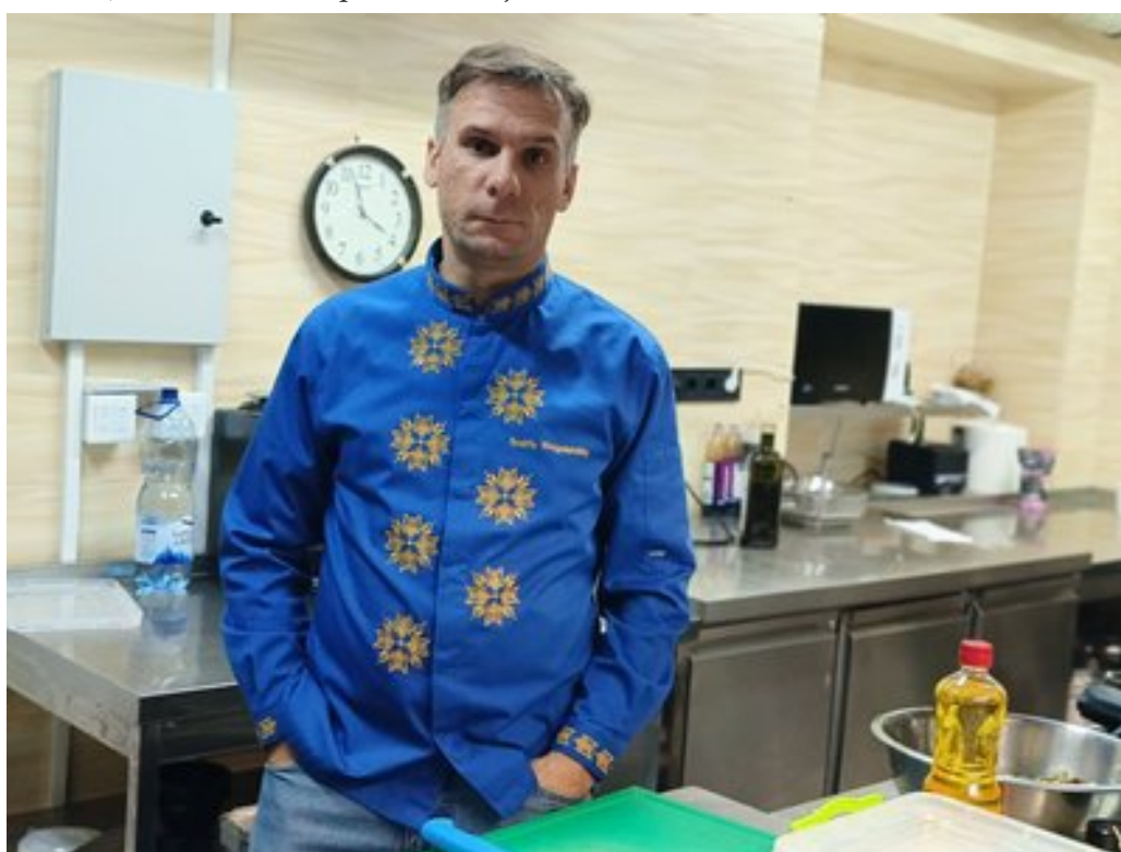
Ресторатор та президент асоціації кухарів України Андрій Магалецький.

"Ми захотіли вигадати якийсь формат, який дозволяв би нам не просити гроші, а робити щось, за що люди отримують емоції, смачні страви, класні лоти, і за це платять. 100 % йде на потреби ЗСУ. Ми не кажемо, що ми збираємо кошти, бо цей проект — кожна вечеря, це до двох місяців підготовки. Ми заробляємо ці кошти", — зазначив Андрій Магалецький.