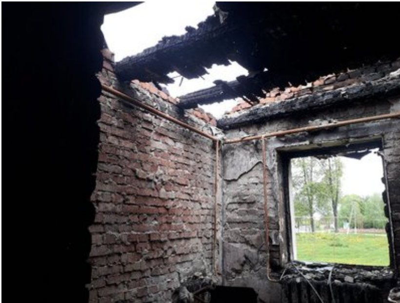
Архів. Зруйнована російськими обстрілами амбулаторія у селі Кіндратівка на Сумщині. 5 травня 2023 р.

- А яка ситуація в самій Хотині? Скільки зруйновано приватних будинків, можливо, господарчих якихось?