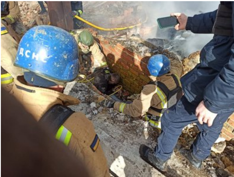
Хотинська громада, лютий 2024 р. Ігор Клименко

- Один з грудневих обстрілів КАБ "прилетів", одразу десять будинків. Чотири не підлягають відновленню взагалі. Інші понакривали, щоб просто не пропадали будинки. Комунальні підприємства працюють постійно. Резерв формуємо будівельних матеріалів для того, щоб забивати вікна в разі пошкоджень, перекривати дахи. Допомогаємо тим, хто залишається, якимось опалювати будинки. Агрофірма зруйнована повністю, там загинули люди. Російські військові вдарили балістикою, коли проводили слідчі дії і фіксували наслідки обстрілу. Теж загинули люди: начальник слідчого управління і заступник.