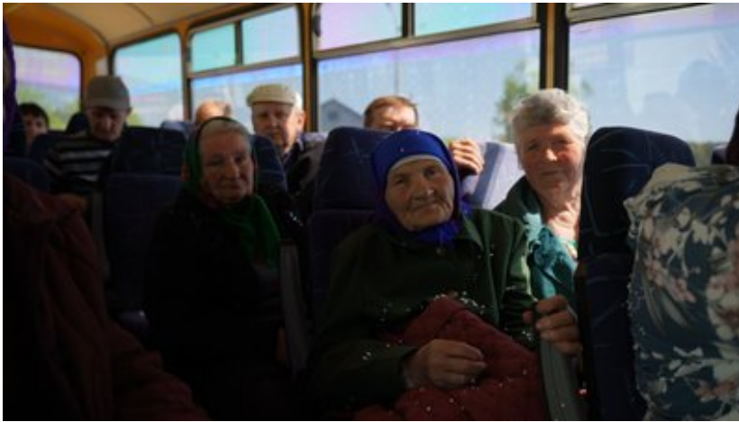
Евакуація з Хотінської громади, травень 2024 р.

- Скільки загинуло у вас цивільних в громаді, і скільки загинуло вже військових з вашої громади?