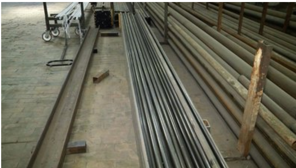
Шестиметрові труби для нарізання деталей.

Зі слів майстра, з однієї труби шестиметрової виходить 250-270 сегментів.