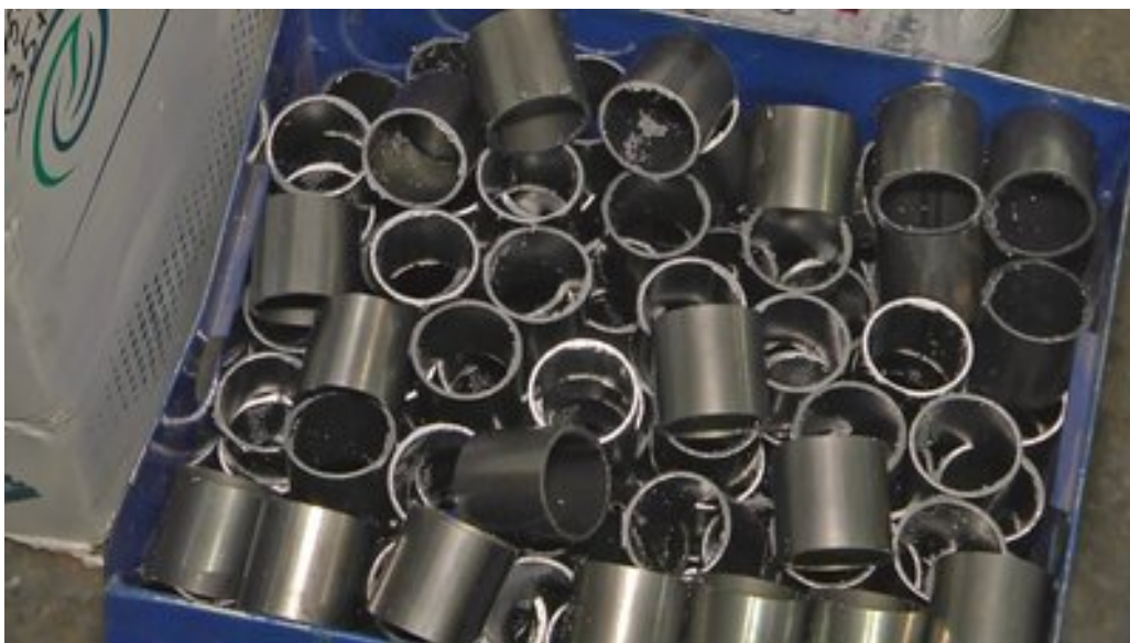
Нарізані сегменти з металевої труби.

Зі слів майстра, з однієї труби шестиметрової виходить 250-270 сегментів.