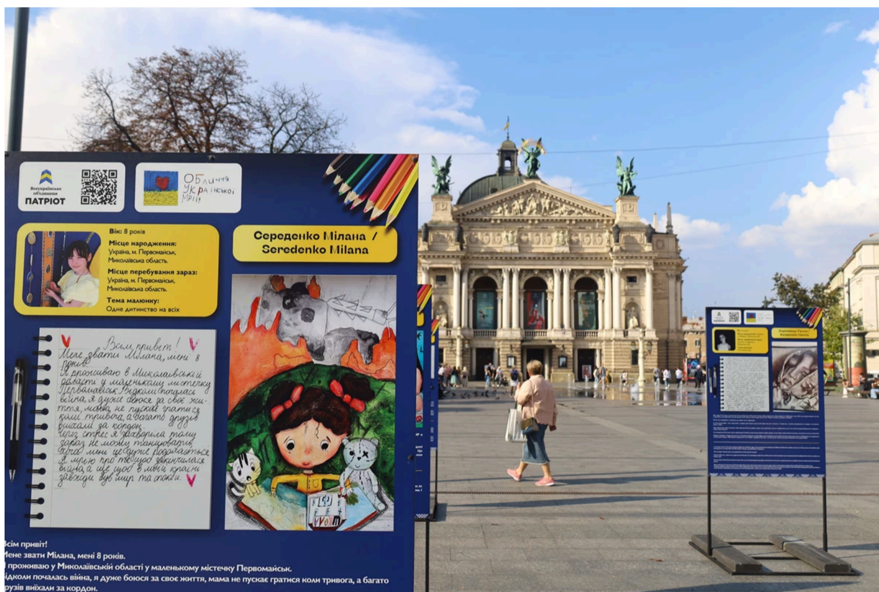
Обличчя Української Мрії (5)

Триватиме виставка до 18 жовтня, потім її експонуватимуть у Дніпрі.