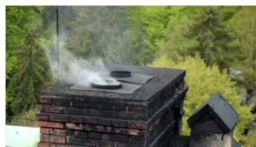
Засіб для немеханічної очистки димарів від значної сажі до 8 мм!