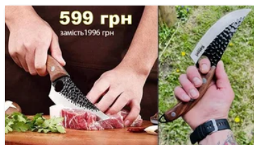
599 грн замість 1996 грн Тонка нарізка! Професійні леза! Японський ніж Satori

« Главком » долучається до хвилини мовчання. Ми вшануємо пам'ять усіх українців, які загинули у боротьбі за Батьківщину. Ми згадуємо загиблих від рук російських загарбників, запалюємо свічки пам'яті та схиляємо голови у скорботі під час загальнонаціональної хвилини мовчання, вшановуючи світлу пам'ять громадян України, які віддали життя за свободу і незалежність держави: усіх військових, цивільних та дітей, усіх, хто загинув у боротьбі з російськими окупантами та внаслідок нападу ворожих військ на українські міста і села.