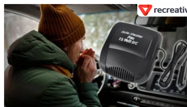
Обігрівач салону: знижка + компресор в подарунок!