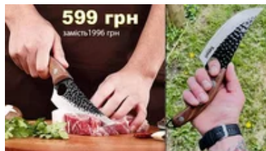
Тонка нарізка! Професійні леза! Японський ніж Satoro