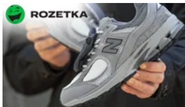
Чоловічі кросівки New Balance. На Rozetka дешевше.