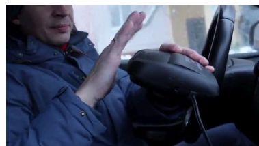
Тепловентилятор на передню панель салону: швидкий обігрів!