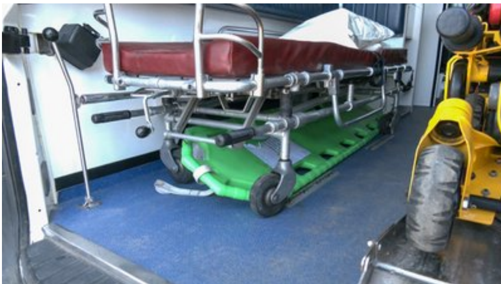
Автівка для евакуації поранених людей з прифронтових населених пунктів, Краматорськ, Донецька область.