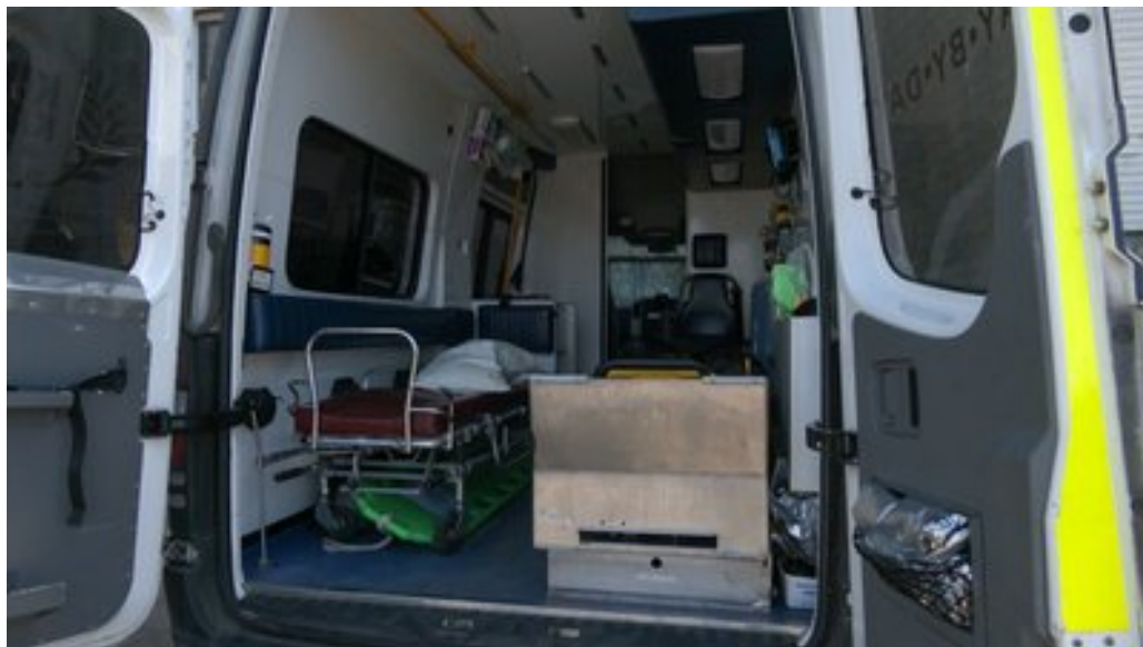
Автівка для евакуації поранених людей з прифронтових населених пунктів, Краматорськ, Донецька область.