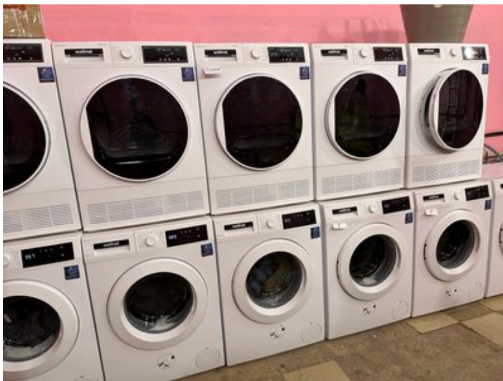
Пральні та сушильні машини у "пункт незламності", Донецька область, лютий 2024 рік.

Обладнаний "пункт незламності" п'ятьма душовими кабінами, три — спільні, і дві — для жінок.