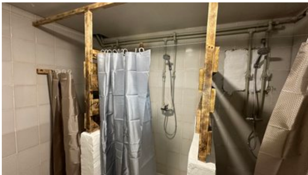
Спільні душові кабіни у "пункті незламності", Донецька область.

"В одній із душових кабінок велика кімната, тут можуть хлопці та дівчата помитись. Це дуже зручно. Тут можна зайти, спокійно роздягнутись, покласти речі та зайти в душ помитися. У нас є бойлерна, будуть бойлери, яких вистачить на всі п'ять кабінок", — розповів волонтер Віталій.