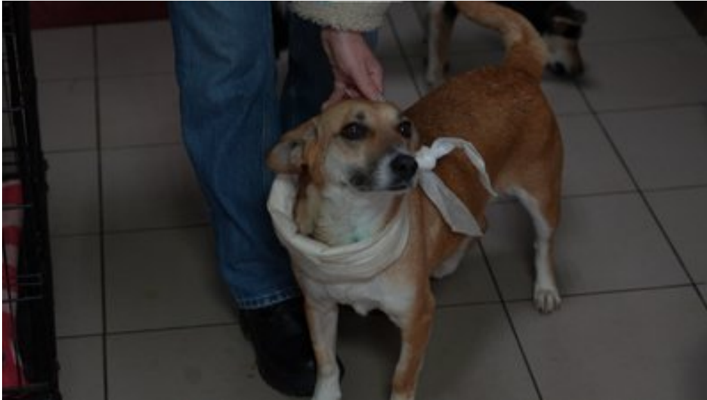
Помадка. Суспільне Дніпро

"Вже майже все зажило, серединка ще заживає. Це собачка з піометрою була. Це гнійне запалення матки. Ну, вже все. Вона вже в нас готова їхати додому, але шукаємо родину", — розповіла зооволонтерка.