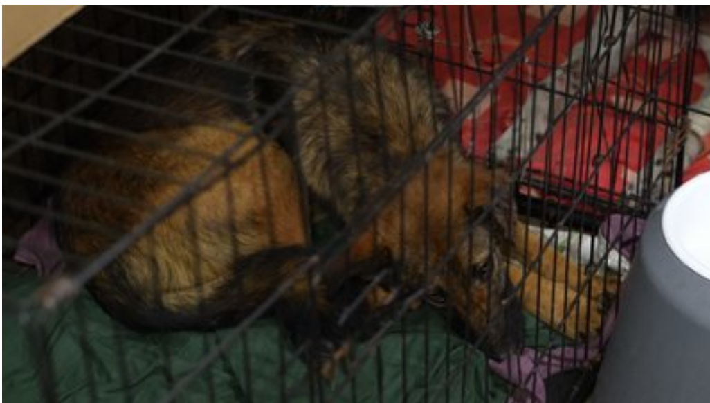
Один із песиків, яких дістали з колючого дроту. Суспільне Дніпро

"Я не знаю, що сталося. Можливо, вони потрапили під обстріли і так далеко забігли. Але ці собаки дикі, їх спіймати неможливо. Вони не даються в руки просто так. Тобто, скоріш за все, був обстріл. Вони живуть у зоні, де обстріли дуже часті. Мабуть, рятувалися, тікали й забігли в таке страшне місце, де людей немає. Нам чисто випадково повідомили, що там ці собаки заплутані в дроті. З великими потугами наш волонтер, хлопчик, який мені допомагає, зміг витягнути тих собак звідти. Їх не можна було просто виплутати, довелося вирізати", — розповіла жінка.