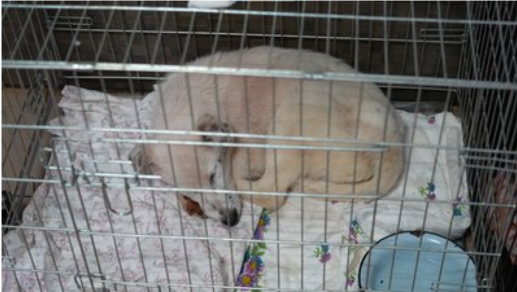
Спенсер. Суспільне Дніпро

"Спершу дуже боявся, але ми потрошку адаптуємо його. Він уже не так боїться рук, але щелепа все ще болить, тому реакція може бути агресивна. Ми зрозуміли, що його отруїли щурячою отрутою. Коли знайшли, він тікав, стікаючи кров'ю. Ми ледь його врятували", — пояснила вона.