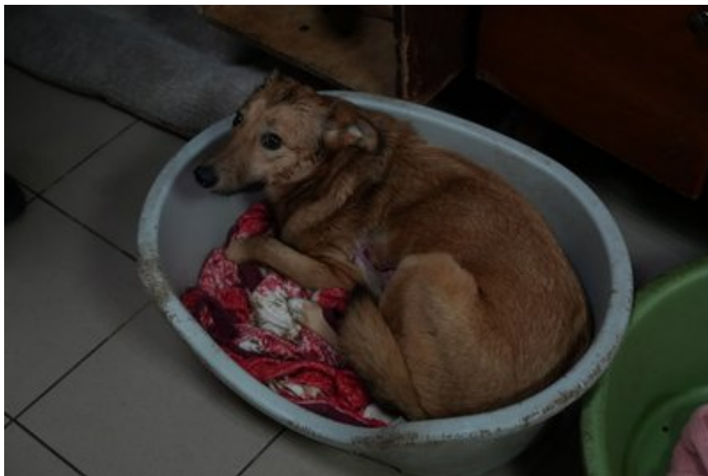
Мешканець притулку.