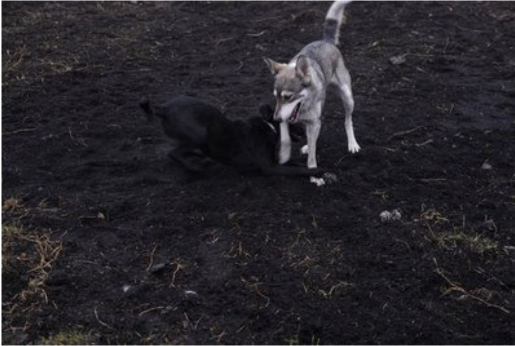
Евакуювані собаки.

"Ніку вони знайшли на вулиці, там було п'ять цуценят чи то в мішку, чи щось таке і коротше додалися вони, там подружились і жили разом в приватному подвір'ї", — розповів зооволонтер.