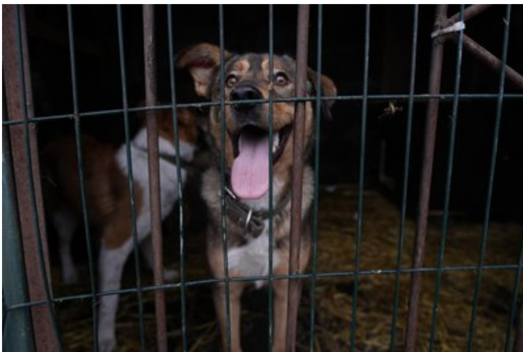
Евакуйований пес.

"На паливо, на корм, побудову та утримання всього притулку. Зараз, коли холодно, дуже потрібна солома. Якщо в когось є можливість передати соломку, будь ласка, ми будемо дуже вдячні, адже потрібно підстелити її тваринам. Якщо хочете привезти допомогу, будь ласка. Якщо хочете приїхати, погуляти з собаками, погратися — також пишіть", — розповідає жінка.