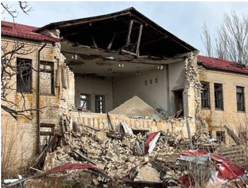
Будинок культури у Березовому після обстрілу РФ.