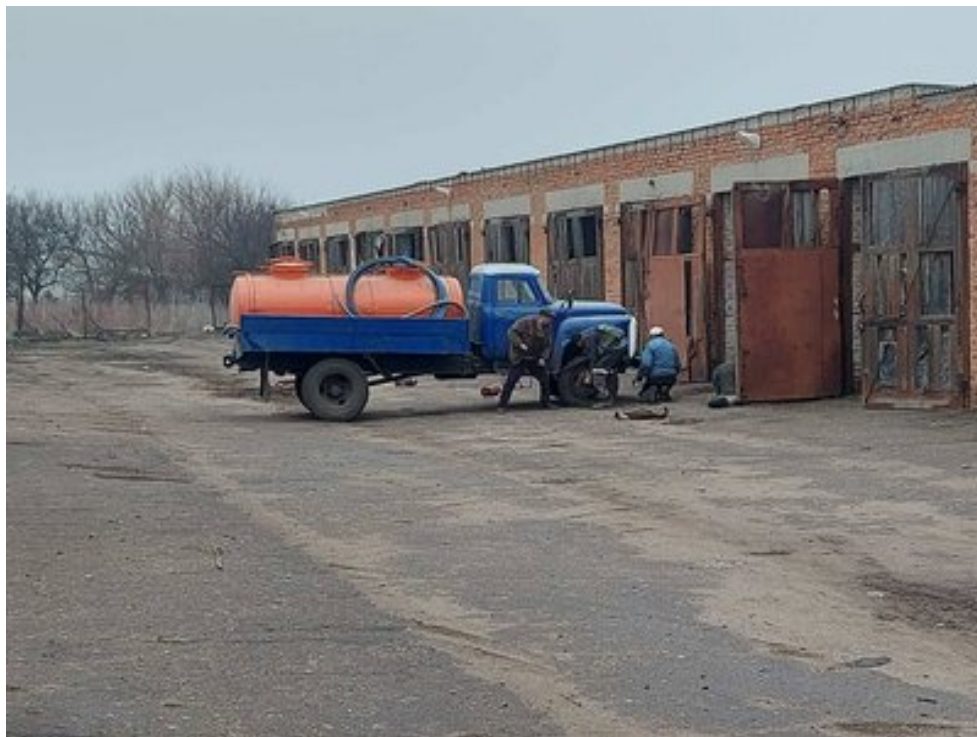
Віктор привіз воду до одного з населених пунктів. Суспільне Дніпро

"Був наступ минулого року, ми були в Темирівці, і російські літаки над Темирівкою випускали ракети — мабуть, оце було найстрашніше. Хлопцям важче там на передку, аніж нам. Тож, чим можемо, тим і допомагаємо", — сказав він.