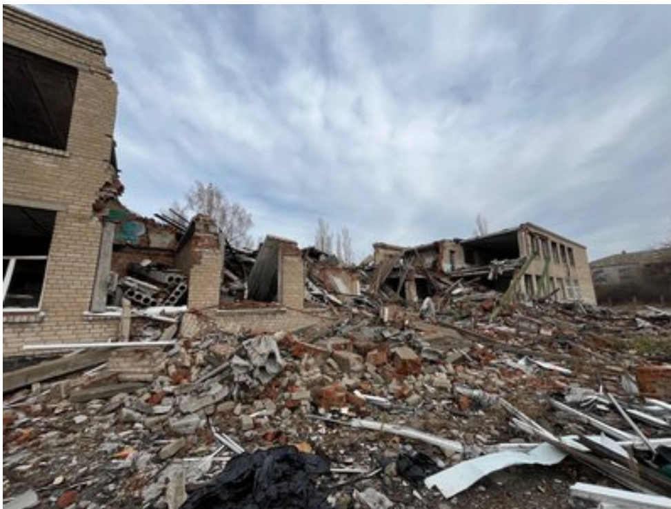
Школа у Березовому після обстрілу РФ.