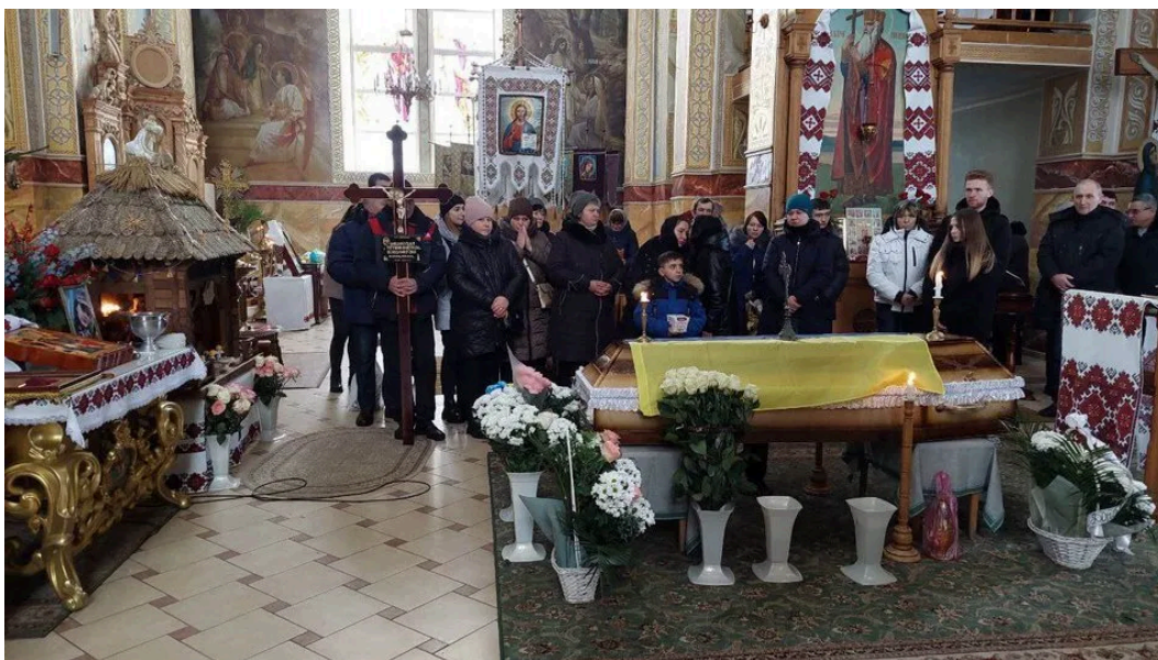
Військову поховали в селищі Івано-Франківське.

"Коли були перші прориви на Попасну, вона брала участь у перших мобілізованих розвідувальних групах, зустрічала ворога", – сказав він.