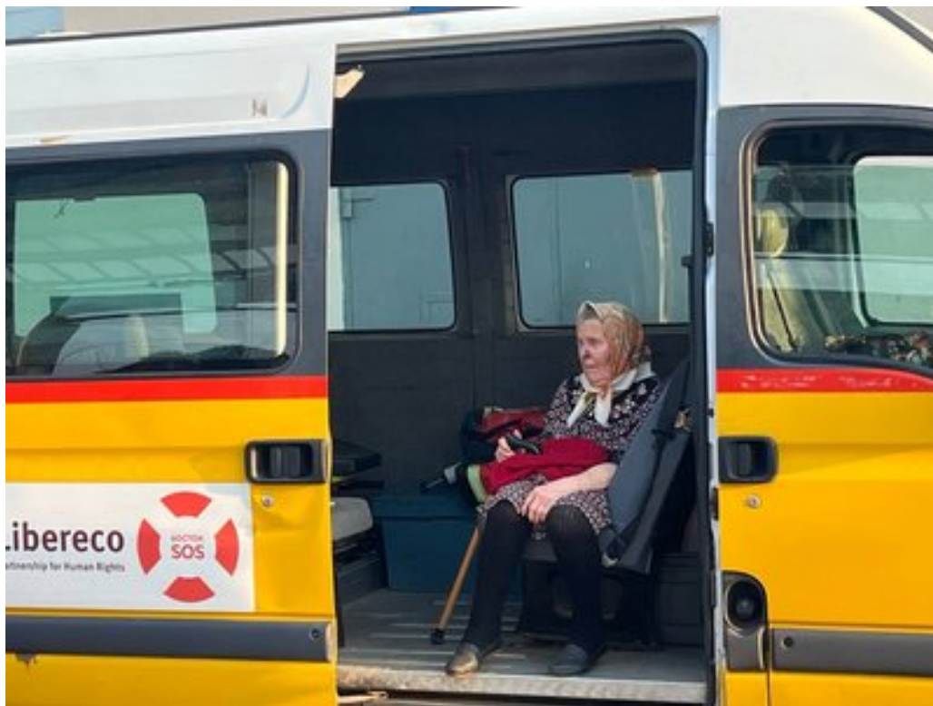
Волонтери продовжують евакуйовувати людей з Донеччини.

"Ми їздимо на звичайних авто, нам дуже потрібні броньовані і дуже потрібні РЕБи, щоб можна було врятуватися від російських дронів. Це дуже ускладнює евакуацію. Особливо з прифронтової зони, де 5 кілометрів до лінії бойового зіткнення", — сказав він.