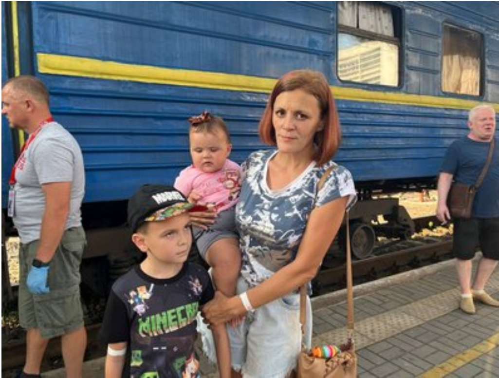
Ольг з дітьми виїхала з Покровська. Суспільне Дніпро

зателефонувала волонтерам та попросила їх евакуювати.