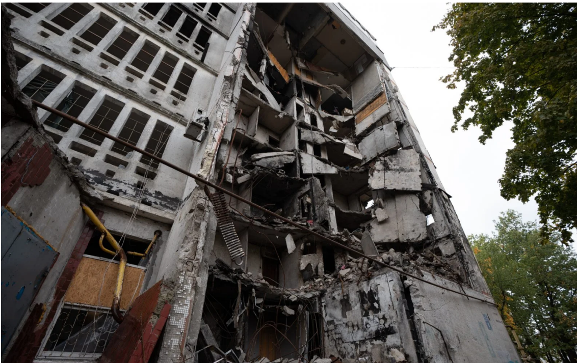
Будинок на вулиці Метробудівників, 8.

27 житлових будинків у Харкові будуть демонтовані, бо не підлягають відновленню. Їхня аварійність визнана інструментальними експертизами. Проте не всі мешканці згодні з такими висновками. Деякі харків'яни розраховують на житловий сертифікат, але обмежені порядком його отримання і залишаються зі своїми