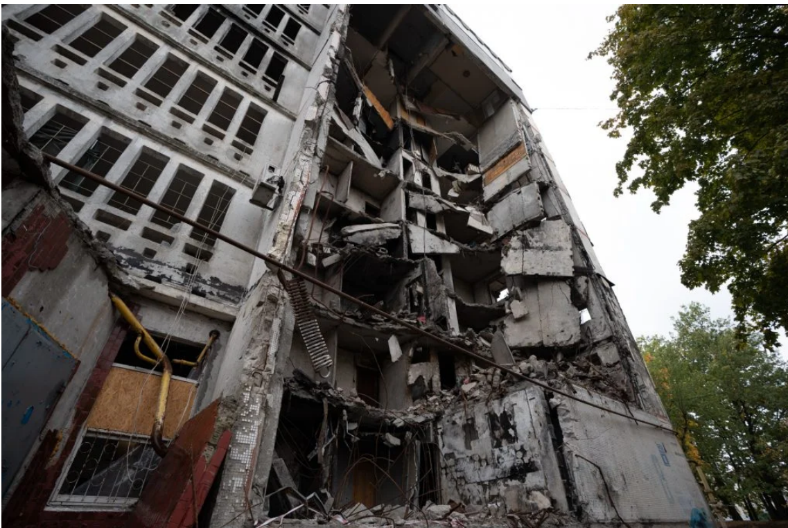
Будинок на вулиці Метробудівників, 8.