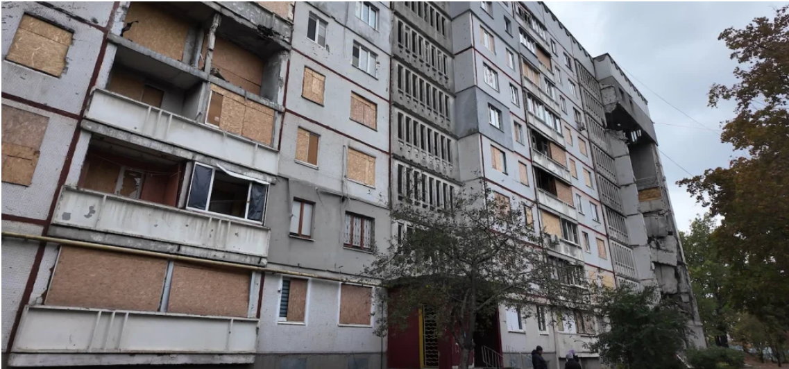
Будинок на вулиці Метробудівників, 8.

За час війни будинок двічі ретельно обстежували. Перша експертиза порекомендувала реконструкцію у 2023 році. За висновком другої — цьогорічної — його треба невідкладно знести: «Наявні значні корозійні та механічні пошкодження, що виникли під агресивним впливом навколишнього середовища».