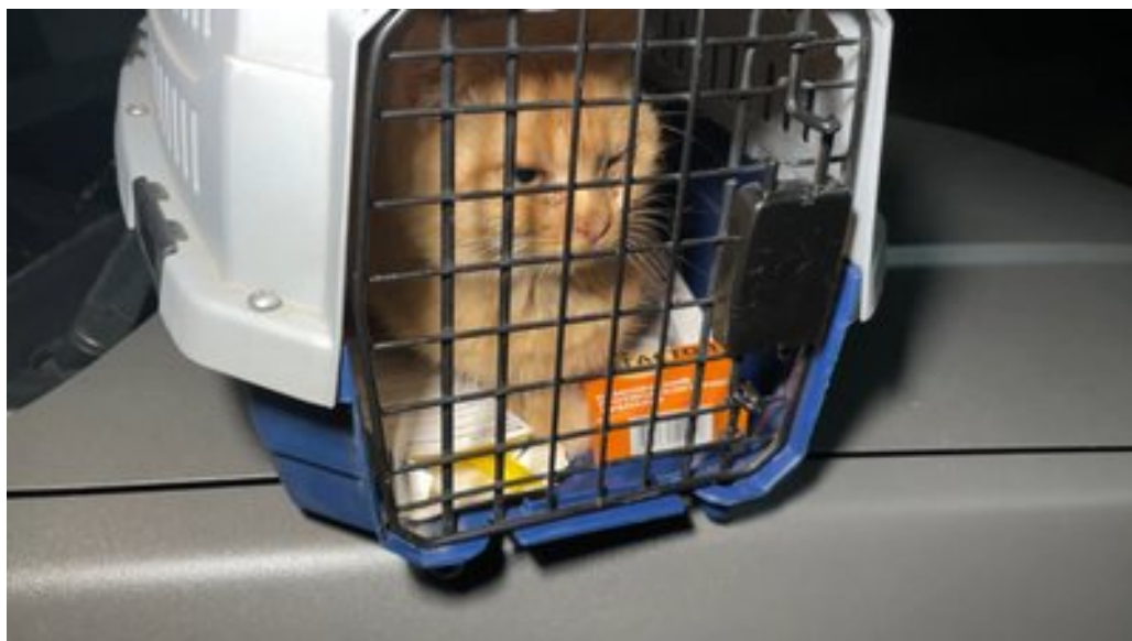
Кіт в переносці.